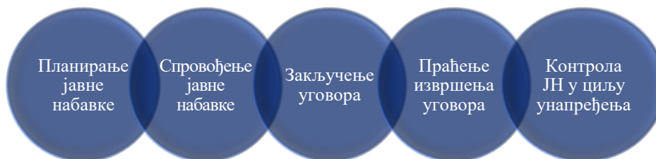
Слика број 1: Фазе поступка ЈН

Закон о јавним набавкама је прописао прагове до којих се закон не примењује 28 . Тако се на пример, одредбе овог закона не примењују на набавку добара, услуга и спровођење конкурса за дизајн, чија је процењена вредност мања од 1.000.000 динара и набавку радова чија је процењена вредност мања од 3.000.000 динара. Спровођење овог типа набавки наручилац уређује интерним актом. Систем ЈН код наручиоца обухвата неколико фаза које приказујемо у наставку.