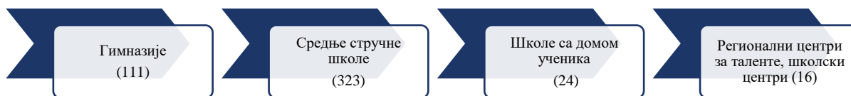
Слика број 2: Преглед установа у средњем образовању

Како би имали уједначен приступ у ревидирању јавних набавки одабрали смо исту категорију субјеката ревизије, односно средње стручне школе (323 установе) чији је основни циљ оспособљавање младих да на професионалан и одговоран начин одговоре потребама тржишта рада и друштва у целини али и да задовоље своје личне потребе и амбиције.